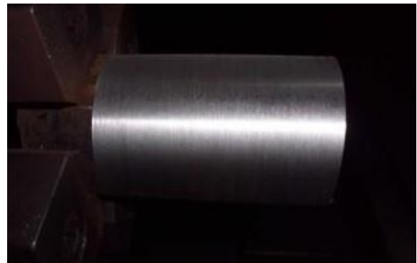
Gambar 3.1 : Bahan uji coba ST41

Bahan yang akan kita gunakan untuk penelitian ini adalah baja ST41 dengan diameter awal 25,4 mm dan panjang 110 mm.